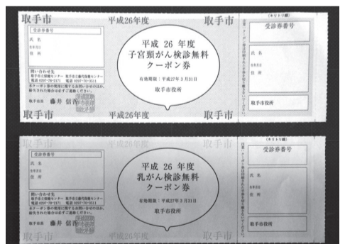
がん検診無料クーポン券

〔歳出の主なもの〕 ・ぬくもり医療支援の拡充 ・2月の大雪により被害を受けた農産物生産施設の再建修繕費用助成金 ・臨時福祉給付金 ・乳がん・子宮がん検診関係経費 ・社会保障・税番号制度導入システムの構築、改修 ・インクルーシブ教育(障害のある子どもとない子ども)