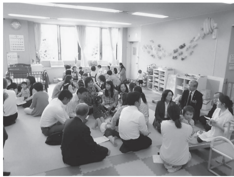
子育て支援センターでの意見交換(5月9日)