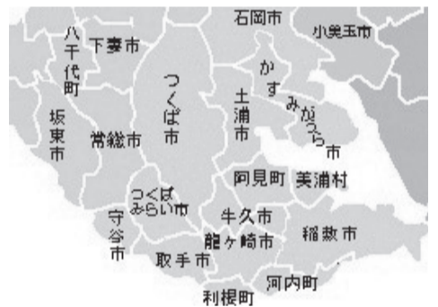
取手市周辺の市町村(茨城県内)

市長 現段階で合併については全くの白紙の状態。国の動向も、市町村合併の取り組みだけでなく、複数の市町村が共同作業の内容、