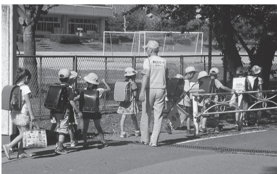
児童の下校を見守るスクールガード(稲小学校)