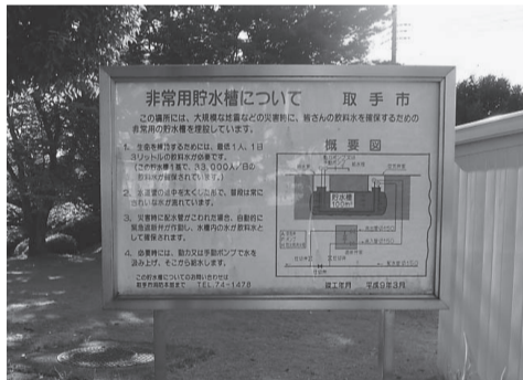
飲料水兼用耐震性貯水槽(戸頭)

問 市の防災計画では、飲 料水兼用耐震性貯水槽は、 小文間・市役所・戸頭にあ り、緊急時に給水するとあ るが、行くのが困難な地域 もある。増設が必要では ないか。