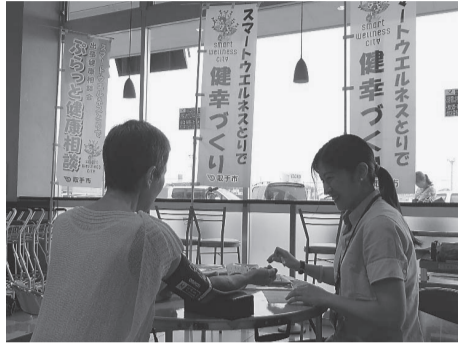
スーパーで行われた「ぶらっと健康相談」(6月)

問 兵庫県尼崎市では、市民の健康を高める取り組みとして、健康診断結果で体の危険度をチェックし、特定指導を行い、新たな病気になる人を大幅に減らすことに成功した。取り組みについての考えは。