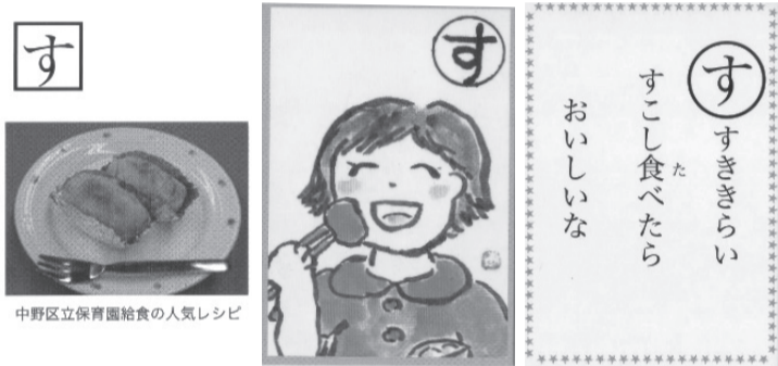
中野区が作成した食育かるた

問 中野区は、高齢者から幼児まで使える食のツールとして食育かるたを作っている。読み札は、川柳を募集し、各種団体の方が組織した「中野区民の健康づくりを推進する会」が選定作業を実施。絵札は、絵手紙サークルが描くなど、さまざまな人が関わっている。裏面には保育園の給食の人気メニューを掲載している。食育のツールの1つとして、市も作成してほしい。 市長 ターゲット層を研究して、市制45周年記念事業として実現できるように取り組みたい。