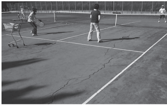
戸頭テニスコート