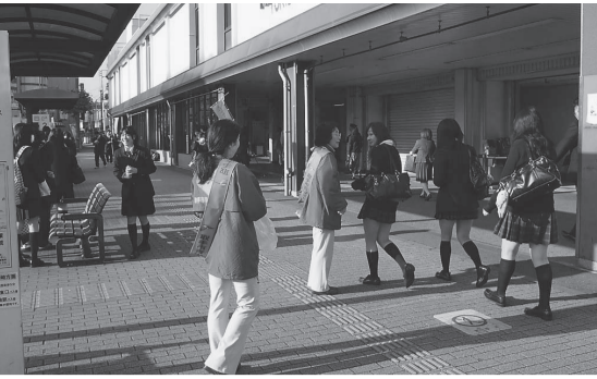
街頭指導を行う青少年相談員

問 市長は駅前の活性化を図るとして開発を進めているが、再開発ビル上階は閉鎖されたまま。本当に活性化につながっているのか。