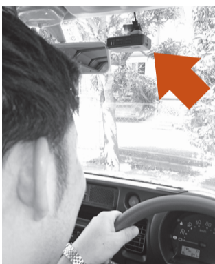
市公用車にも設置され始めたドライブレコーダー（写真上部）

問 防災行政無線の運用実態は。 総務部長 平成19年度から運用。定時放送と、災害の非常事態や人命に係る緊急放送がある。 問 利根川増水時など、樋管の水門閉鎖時には内水被害に遭うことがある。放送を活用できないか。 総務部次長 各機関が連携して連絡網を整備している。また、閉鎖・解放の情報を市メールマガジンで配信し始めたことや、排水ポンプ車も導入。被害回避できると考える。 問 近隣市の女子児童殺害事件では防犯カメラやドライブレコーダーが有効であった。市の整備状況と今後は。 答 平成21年から防犯カメラを運用。駅前など26カ所56台を設置、警察からの正式な依頼があった際は、画像を提供している。