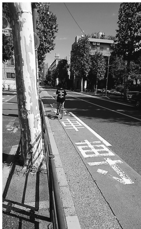
渋谷区の自転車通行帯

※1週間当たりの正規の勤務時間は38時間45分 ※黒い線は残業時間が1週間当たり20時間以上になる目安。労働基準法では残業時間の上限を月平均80時間以内と定めている。 出展：「教員勤務実態調査（平成28年度）の集計（速報値）について」（文部科学省）（ http://www.mext.go.jp/b_menu/houdou/29/04/_icsFiles/afieldfile/2017/04/28/1385174_002.pdf ）を引用。