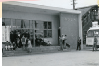
写真①藤代駅(昭和36年ごろ)

藤代駅は、これまで線路で分断されていた南北の往来を容易にし、まちの活性化につながりました。写真③は新しい藤代駅の下に旧藤代駅が残っていた時の様子です。