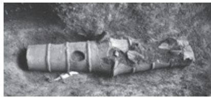
はにわ 埴輪を利用した珍しい埴輪棺