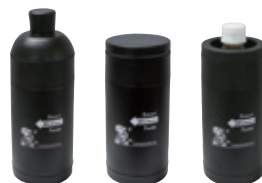
①3way ステンレスボトル