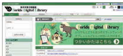
電子図書館ホームページ