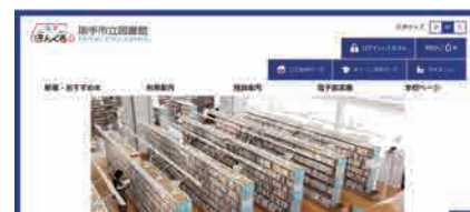
取手市立図書館ホームページ