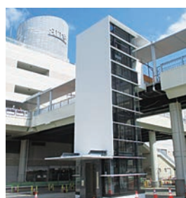
新しいエレベーター (6月19日時点)