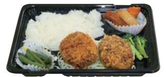
※6月20日のお弁当です。