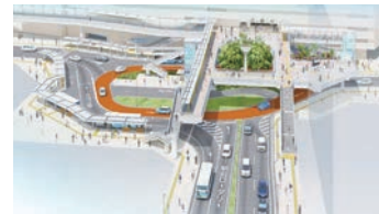
取手駅西口駅前交通広場 完成イメージ

7月3日(月)には、駅前交通広場中央部に位置する新しいエレベーターが利用開始となり、計画的に整備工事を進めています。