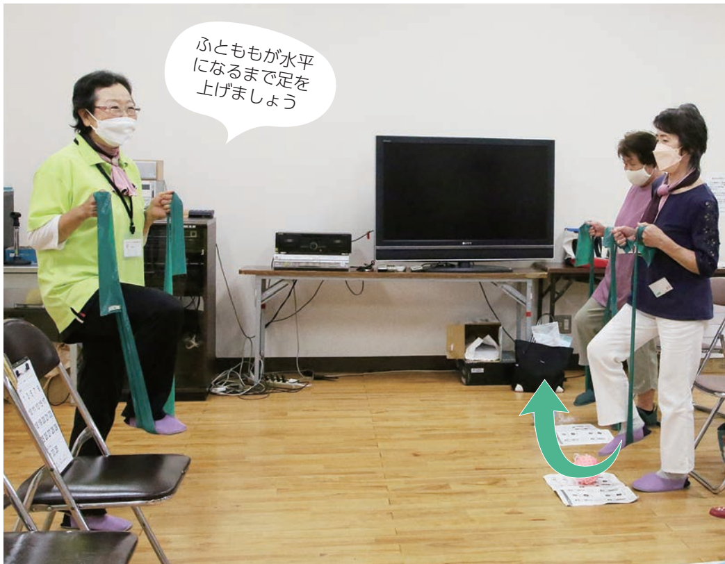
(写真左) 脚力強化・転倒予防の体操 (写真右) 肩こりや肩関節痛予防・改善の体操