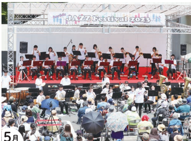
5月 取手JAZZ Festival 2023 Part1