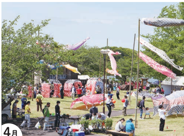
4月 こい 鯉のぼりプロジェクトin岡堰 おかげき