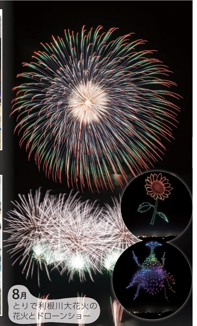
8月 とりで利根川大花火の 花火とドローンショー