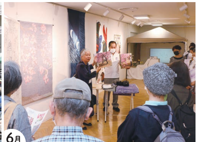
6月 取手美術作家展(とりび)のギャラリーツアー