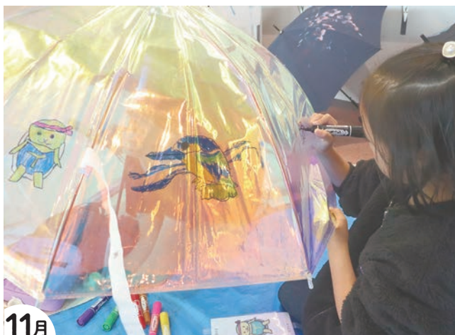
11月 忘れ物傘アートワークショップ(アートアンブレラ)