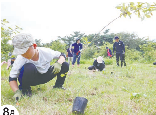
8月 夏休み探究ツアー inみなかみでの植林体験