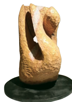
彫刻「地から宙から」安ちか子さん