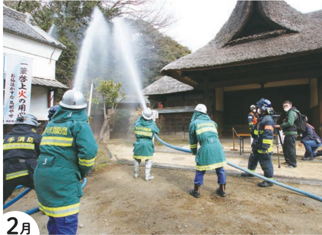
2月 旧取手宿本陣染野家住宅で防火訓練