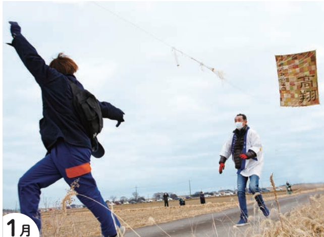
1月 高須で空あそび