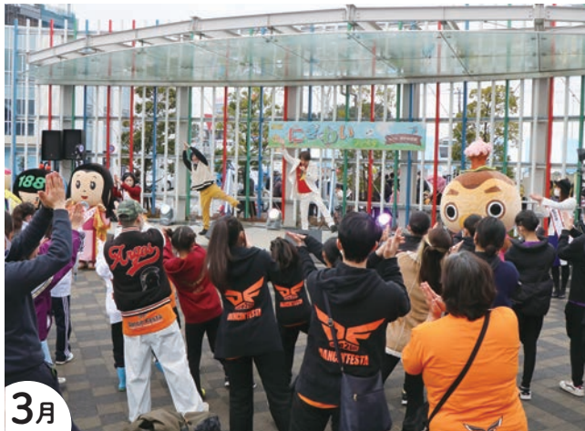
3月 駅前にぎわいフェスタWith取手映画祭