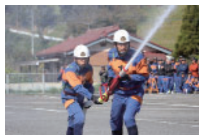
ポンプ車の部で優勝した第3分団