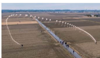
令和6年2月に揚げた連凧アーチカイトの様子