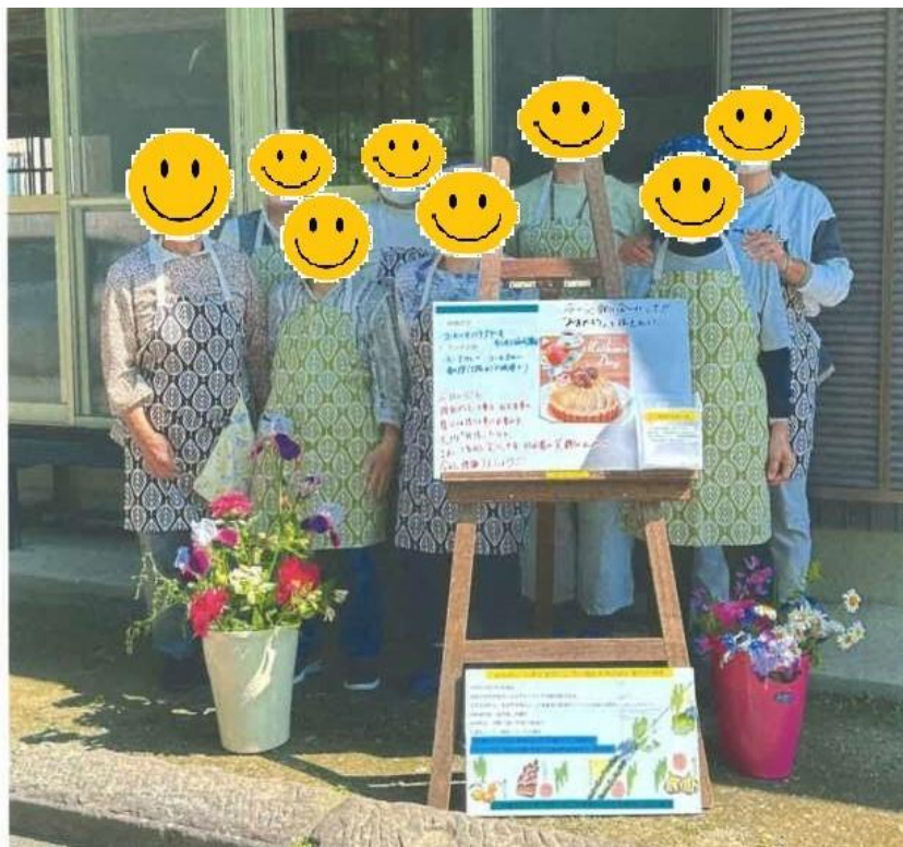
一周年による会員の集合写真

※ 料理の反省会と次回の 献立協議・連絡事項等を 1時間実施することで、 問題点の共有を図る。