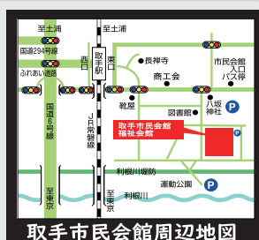
取手市民会館周辺地図

※出演者・出演時間はやむを得ない理由により変更になる場合があります。 ※駐車場が少ないため、公共交通機関をご利用ください。