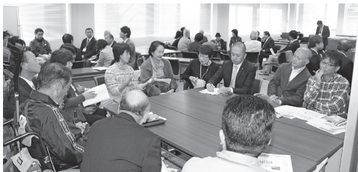
前回の議会報告会

【お願い】 駐車場は有料です。台数に限りがありますので、公共交通機関の利用にご協力ください。