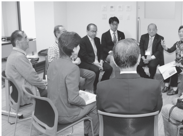
議会報告会で行われた意見交換

議会報告会で出された意見・要望から7つの重点項目を市へ要望し、検討結果を求めました。