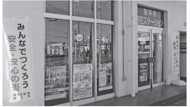
8月に開所した取手市防犯ステーション