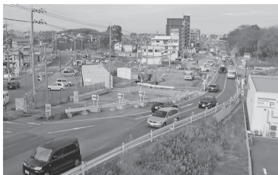
国道294号線 白山八丁目交差点

総務部長 設立時に1団体 5万円を補助している。 安全安心対策課長 取手市 防犯連絡協議会から提供す ることもある。