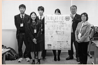
取手松陽高グループ