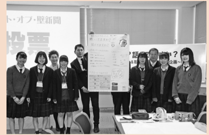
取手二高グループ

徳女子の五つの高校です。また、市職員は、保健センターが中心となって市内のさまざまな部署から参加している「取手市のちを守るネットワーク会議」を中心としたメンバーで、全体の進行は市議会事務局職員が務めました。写真は、学校ごとにまとめた壁新聞と作成メンバーです。(関連1ページ)