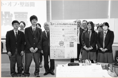
取手一高グループ