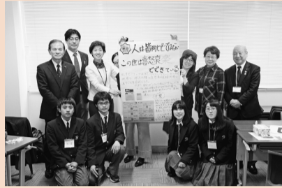
藤代紫水高グループ