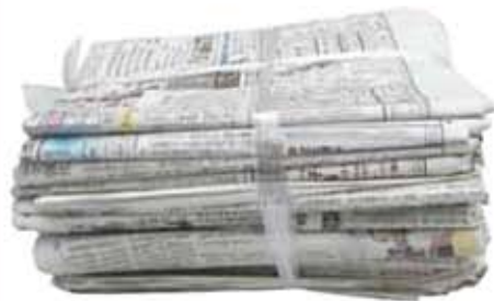
ひもで十文字にしぼる