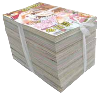
ひもで十文字にしぼる