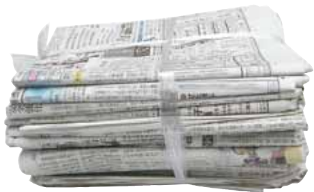
ひもで十文字にしぼる