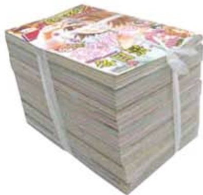
ひもで十文字にしぼる