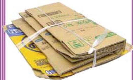
ひもで十文字にしぼる