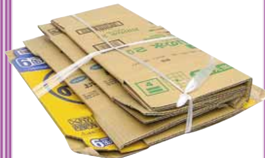
ひもで十文字にしぼる