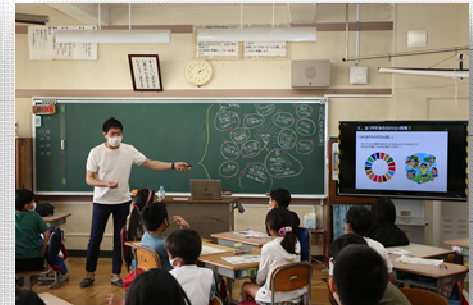
サステナブル学習プロジェクト