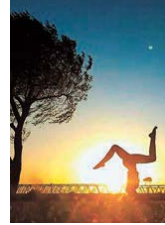
ヤナギの木の下で ヨガのポーズ