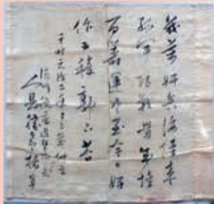
▲人見寧が箱館戦争で使用した指揮旗(人見寧則氏蔵)

広瀬誠一郎は下高井の名主を務め、明治に入り茨城県議会議員や北相馬郡長を歴任した後、利根運河会社を設立し、利根川と江戸川を結ぶ利根運河を完成させました。人見寧は、戊辰戦争では旧幕府軍として各地を転戦、五稜郭(函館市)に立てこもり最後まで新政府軍と戦いました。人見は後に茨城県令(現在の県知事)となり、広瀬と共に利根運河会社を設立しました。今回展示する人見が使用した指揮旗(右写真)は貴重な資料です。