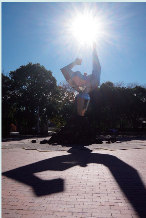
前回最優秀賞「太陽と大地のパワー」