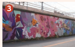
Four seasons of flowers