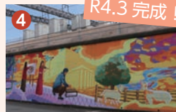
取手の街と利根の龍