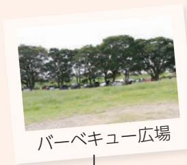
バーベキュー広場

秋は彼岸花にコスモス、春はポピーが咲き並ぶ花の運河。花々が小貝川の河川敷を彩ります。