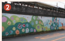
未来につなぐ小さなキラキラ