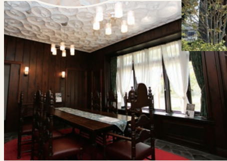
▲漆喰で立体的な装飾が天井に施された食堂(1階)