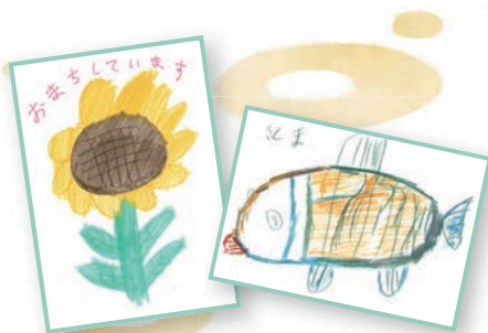
▲施設利用者の作品

各施設の利用者数が増えたため、新しい職員を募集します。10年以上勤務している方も多く、安定して働ける職場です。利用者の皆さんと一緒に楽しく働ける方をお待ちしています。