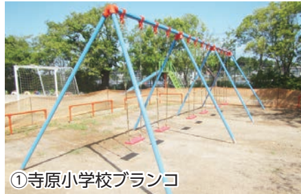
① 寺原小学校ブランコ

寄付総額(件数) : 10億8,287万2,345円(6万3,828件) 市内(件数) : 36万6千円(13件) 市外(件数) : 10億8,250万6,345円(6万3,815件)