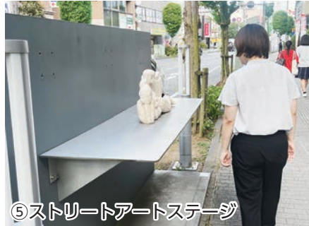
⑤ ストリートアートステージ