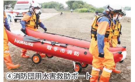
④ 消防団用水害救助ボート