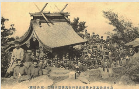
▲明治44年9月 取手尋常高等小学校高等科生筑波登山記念絵はがき