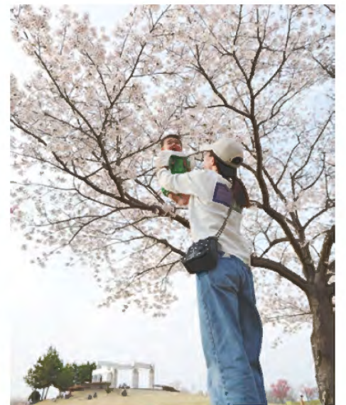
フヨウ FUYOUアリーナ藤代