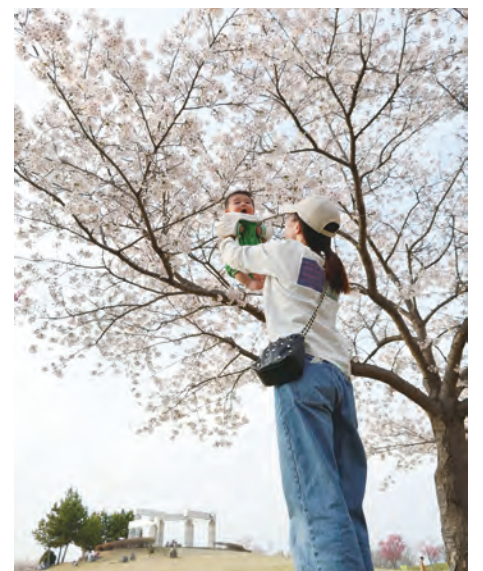
フヨウ FUYOUアリーナ藤代