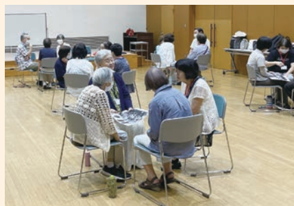
アシスタントボランティアと一緒に、小グループでテーマに沿って楽しくおしゃべりをします。

市は、認知症予防のための「回想法スクール」を、日本回想法学会に委託して実施しています。