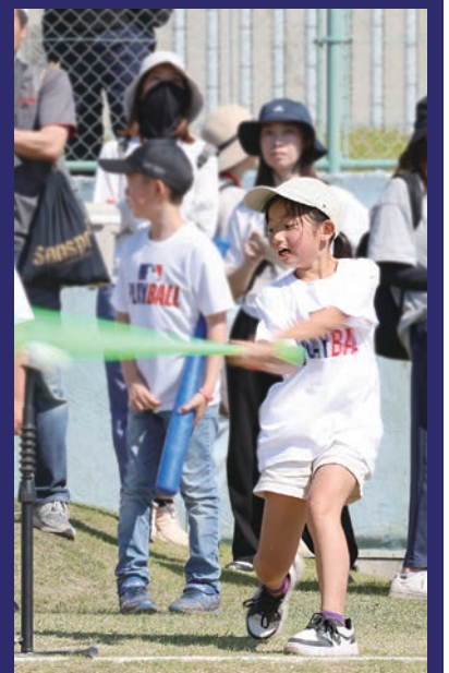
バッティングを体験!