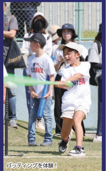
バッティングを体験!