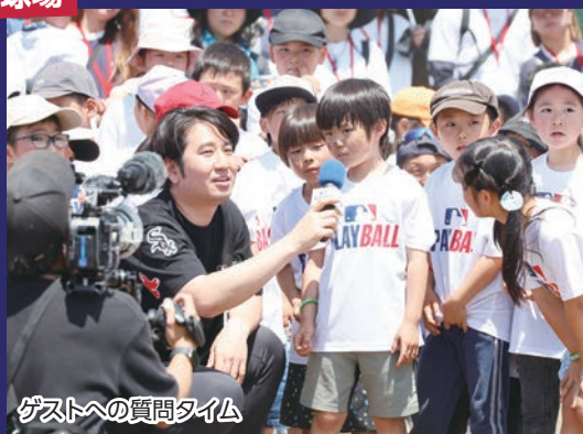
ゲストへの質問タイム