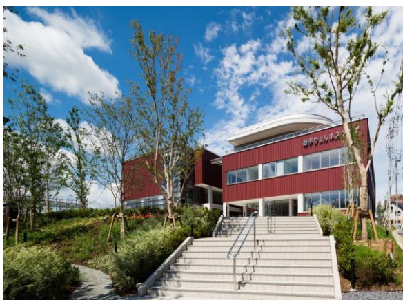
(取手ウェルネスプラザ)

市民交流機能、子育て支援機能、健康づくり機能を兼ね備えた施設として整備され、年間約20万人に利用されている。 特に「キッズプレイルーム」は、子供の成長に応じた遊具が配置され、市内外から年間約43,000人の親子連れに利用されている。