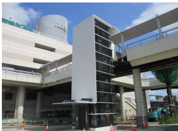
(エレベーター2号機)