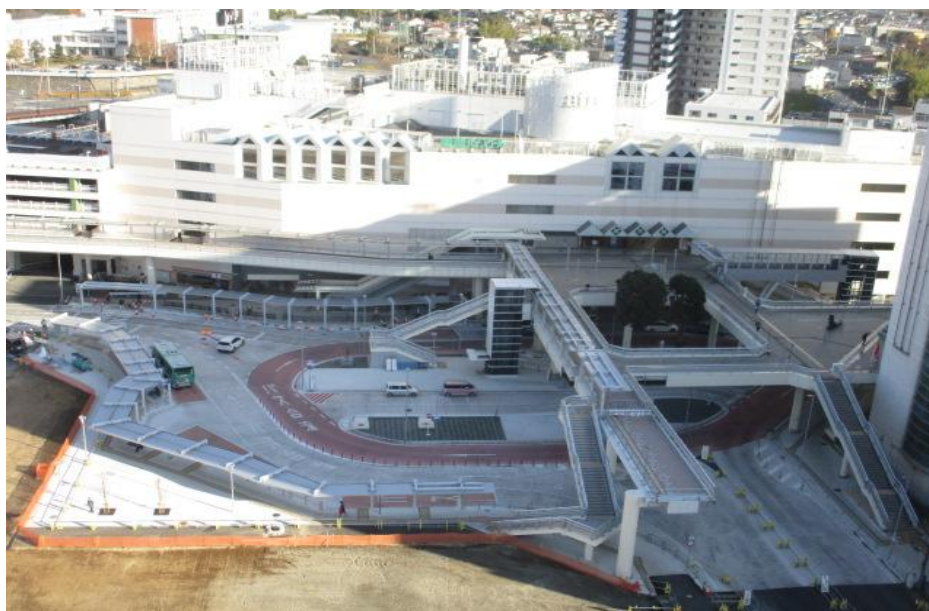
(取手駅西口交通広場)