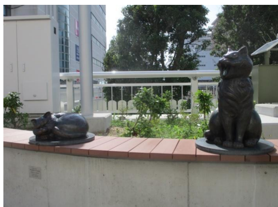
(ブロンズ像『よりどころ』)