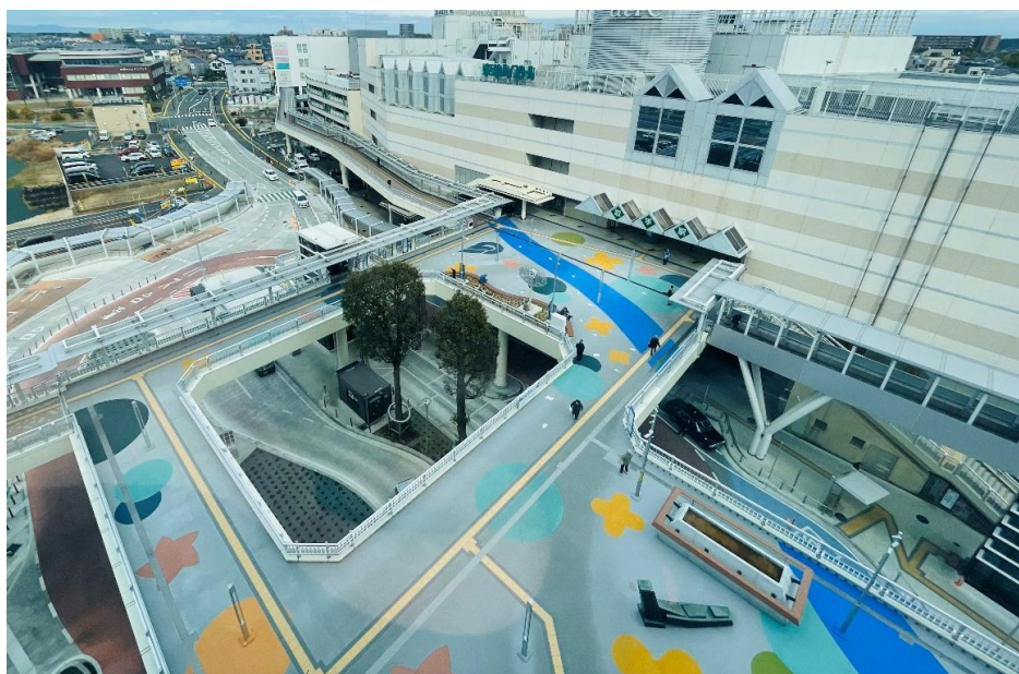
(取手駅西口ペデストリアンデッキ)