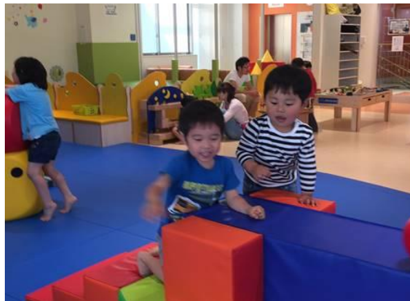
(キッズプレイルームで遊ぶ子供たち)