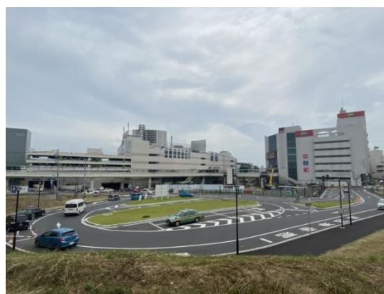
(仮設交通広場 令和5年撮影)

従前の交通広場の機能をA街区に移設し、新しい交通広場の供用開始するまでの間、利用出来るように仮設交通広場を整備した。