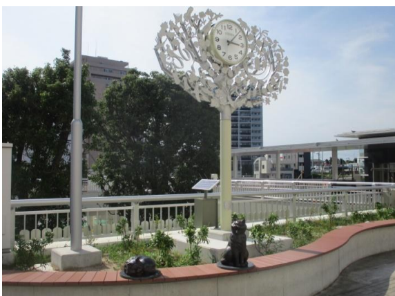
(アート時計塔『共生の樹』)