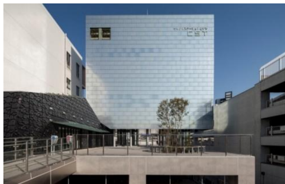
(サイクルステーションとりで)

オープン以来90%を超える利用率となり、また、年間の放置自転車撤去台数も整備前に比べ大幅に減少し、まちの景観や歩行環境の向上に寄与している。