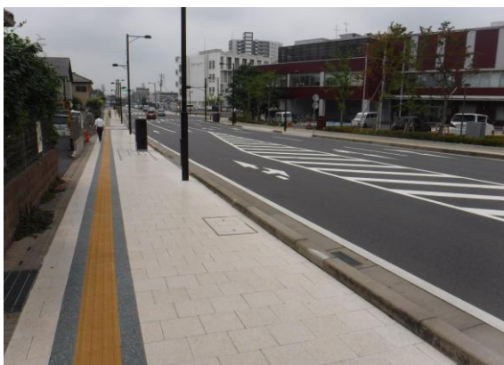
(高質感の平板ブロック歩道)

本地区は、災害対応および景観に考慮するため電線共同溝工事を行い、無電柱化を進め、あわせて誘導ブロック等の設置によりバリアフリーを推進している。また、国道6号と都市計画道路3・4・8号が交差する白山前交差点周辺は、西口地区全体において、歩行者回遊導線上の結節点であり憩う・飾る・集うの機能を備えた滞在型ポケットパークを整備した。