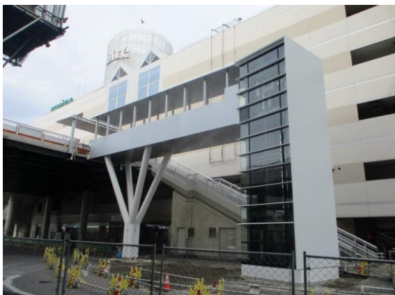
(エレベーター1号機)