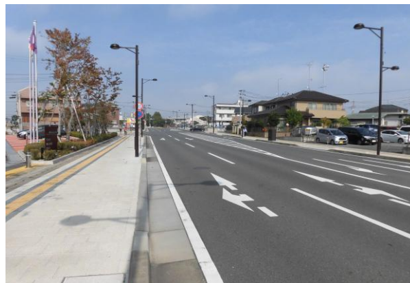
(都市計画道路3・4・8号 平成20年撮影)