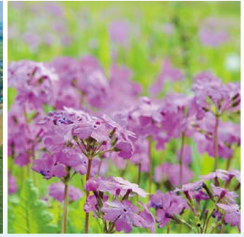
3 サクラソウ [4月]

Toride City is surrounded by a rich natural environment. The Tonegawa River to the south and the Kokaigawa River to the north create wonderful scenic views, generating both dynamism and a therapeutic effect for the people who live there.