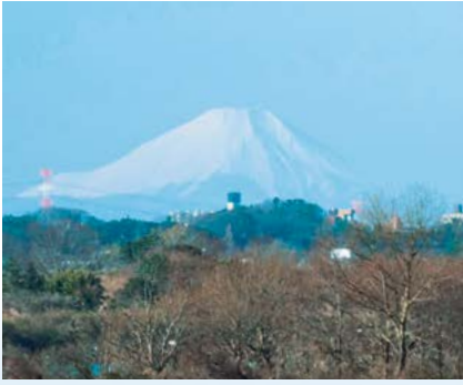
1 利根川堤防から望む富士山 [1月]