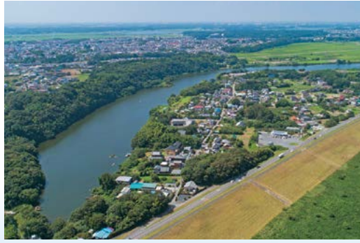
2 古利根沼 [8月]