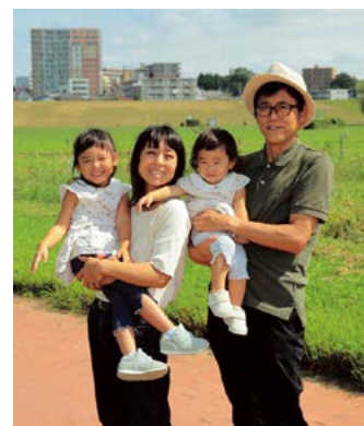
2人のお子さんも大満足の乗船体験となりました。

家族で渡し船に乗り、利根川の雄大な自然を満喫することができました。また渡し船もリニューアルされたということで、非常に快適な乗り心地でした。子どもたちもデッキに登ったり、客室に入ったりと、さまざまな楽しみ方ができて大満足でした。改めて観光気分を味わうことができ、取手市の新たな魅力を発見できた気持ちです。小堀の渡しは、取手市の最高のスポットだなと感じました。