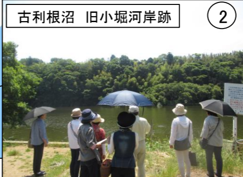
古利根沼 旧小堀河岸跡 2