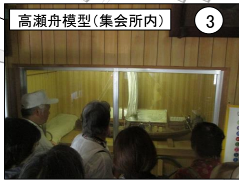
高瀬舟模型(集会所内) 3