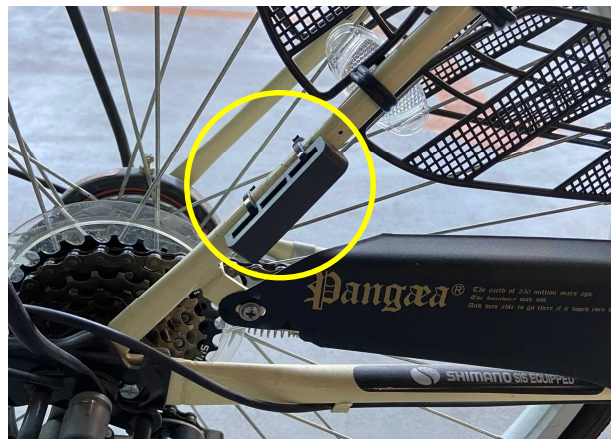
写真② IC タグ

機械式をご契約の際に、IC カードと IC タグを配布いたします。 タグは写真②のように自転車の後輪付近に取り付けます。