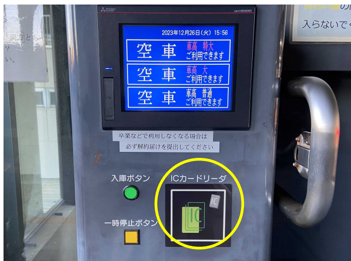
写真⑥ カードリーダー