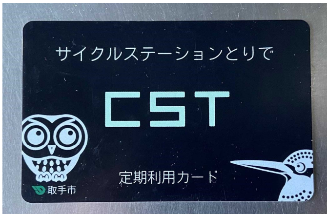
写真① IC カード