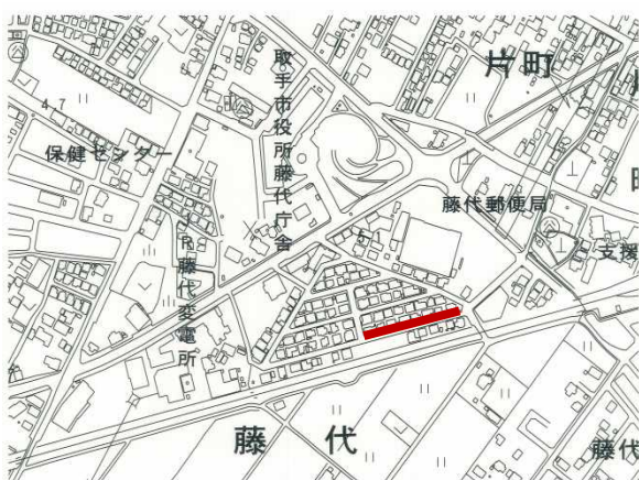
2756 藤代地区雨水排水