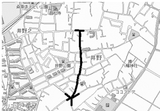
2506 井野下沼（市道 4318 号線他）