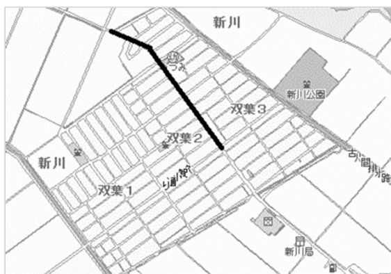
2029 双葉(市道 0130 号線他)