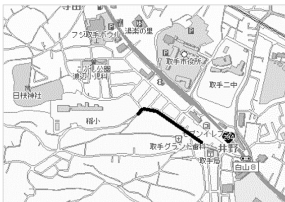
2504 稲向原 (市道 2494 号線)